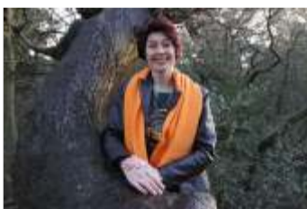
Ria de Groot Appelscha Nr. 3

OoststellingwerfsBelang, uw betrouwbare partner in Ooststellingwerf